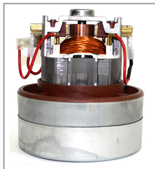
搭載高效率專業馬達