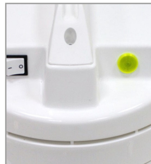
集塵量及阻塞警示燈