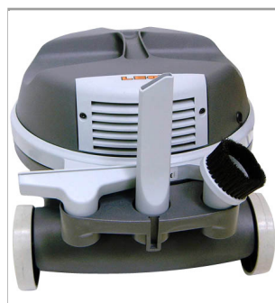
攜戴式配件設計.方便使用