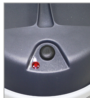
集塵量及阻塞警示燈