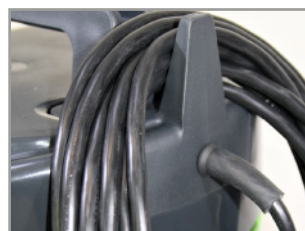
方便電線收掛設計