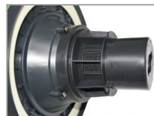
獨特耐油密封墊及防泡沫過濾架組