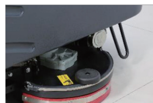
配備防側翻系統設計