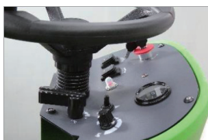
直覺式簡易操作方式